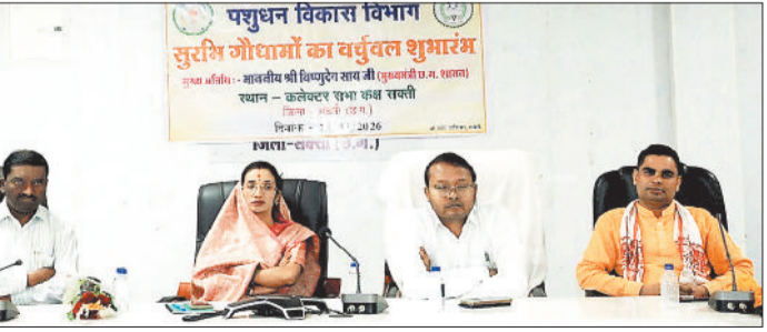
गौधाम योजना के शुभारंभ अवसर पर उपस्थित अतिथिगण।

हरिभूमि न्यूज सक्ती छत्तीसगढ़ शासन मुख्यमंत्री विष्णु देव साय ने शनिवार 14 मार्च को बिलासपुर के लाखासार से गौधाम योजना का वर्चुअल शुभारंभ किया। इस योजना के अंतर्गत प्रदेश में 29 गौधामों की शुरुआत की गई है। प्रथम चरण में 152 गौधाम बनाए जाने का लक्ष्य रखा गया है, वहीं चरणबद्ध रूप से पूरे प्रदेश में 1460 गौधाम विकसित करने की योजना है। यह पहल प्रदेश में घुमंतू एवं निराश्रित पशुओं के संरक्षण और बेहतर प्रबंधन की दिशा में एक महत्वपूर्ण कदम साबित होगी। इस अवसर पर जिला प्रशासन एवं पशुधन विकास विभाग के संयुक्त तत्वावधान में कलेक्टर कार्यालय के सभाकक्ष में जिला स्तरीय कार्यक्रम का आयोजन किया गया। कार्यक्रम की मुख्य अतिथि जिला पंचायत