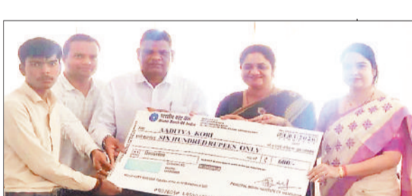
मेधावी छात्र को प्रोत्साहन राशि का चेक देते अतिथि।

भारतीय हाथकरघा प्रौद्योगिकी संस्थान चांपा में अध्ययनरत मेधावी छात्र-छात्राओं को प्रोत्साहित करने के उद्देश्य से सम्मान समारोह आयोजित किया गया। इस अवसर