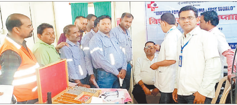
नेत्र शिविर में आंखों की जांच करते चिकित्सक।

हरिभूमि न्यूज अकलतरा विश्व ग्लूकोमा दिवस के अवसर पर कार्यालय 'खंड चिकित्सा अधिकारी, सामुदायिक स्वास्थ्य केंद्र अकलतरा के तत्वावधान में जेएसडब्ल्यू महानदी पावर कंपनी लिमिटेड परिसर में नेत्र जांच शिविर का आयोजन किया गया। शिविर का उद्देश्य कर्मचारियों एवं मजदूरों में आंखों से संबंधित बीमारियों के प्रति जागरूकता बढ़ाना तथा समय पर उपचार सुनिश्चित करना रहा। शिविर में कुल 78 कर्मचारियों एवं मजदूरों की आंखों की जांच विशेषज्ञ चिकित्सकों द्वारा की गई। जांच के दौरान जिन कर्मचारियों