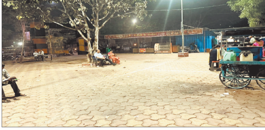
चौपाटी में दुकानें नहीं लगने से पसरा सन्नाटा।

पिछले कुछ दिनों से जिले में गैस सिलेंडर की किल्लत बढ़ते जा रही है। व्यवसायिक सिलेंडर नहीं मिलने के साथ ही घरेलू सिलेंडर के व्यवसायिक उपयोग पर रोक लगाने प्रशासन की टीम द्वारा लगातार छापा मार कार्रवाई की जा रही है। इसको लेकर होटल, ढाबा और ठेला, खोमचे वालों में हड़कंध मच गया है। स्थिति यह है कि व्यवसाय चलाने के लिए व्यवसायिक गैस सिलेंडर उन्हें मिल नहीं रहा है और यदि वे घरेलू सिलेंडर का उपयोग करते हैं तो जल्दी की कार्रवाई होने लगी है। इसका सीधा असर जिला मुख्यालय के चौपाटी में भी देखने को मिल रहा है। सिलेंडर की किल्लत के चलते हमर चौपाटी में लगने वाली आधे से अधिक दुकानें गायब हो गई हैं। इसके अलावा शहर सहित जिले के चांपा, अकलतरा, अकलतरा, पामगढ़, शिवरीनारायण, बलौदा सहित अन्य शहरों और कस्बाई इलाकों में होटल ढाबा संचालक भी परेशान हैं।